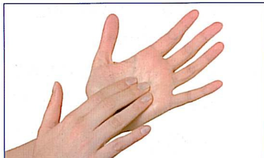
Håndfladernes furer vaskes på begge hænder