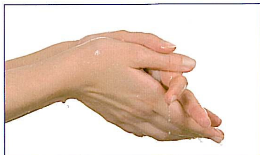
Sæberester skylles omhyggeligt af