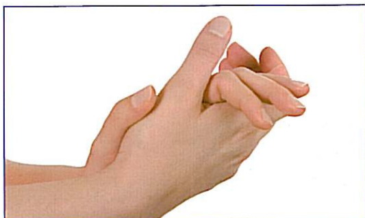
Hænderne gøres våde, og sæben fordeles