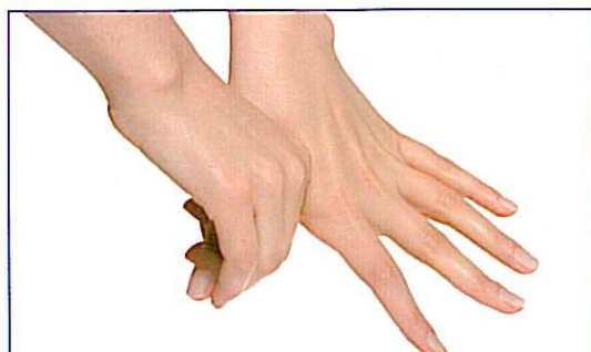
Tommelfingerens bagside vaskes på begge hænder