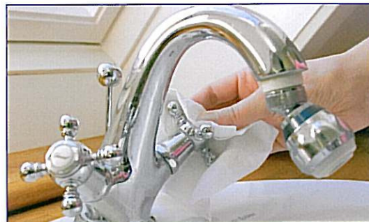
Vandhanen, som ikke er ren, lukkes med engangshåndklæde

Læs mere i Hygiejne i daginstitutioner, Sundhedsstyrelsen.