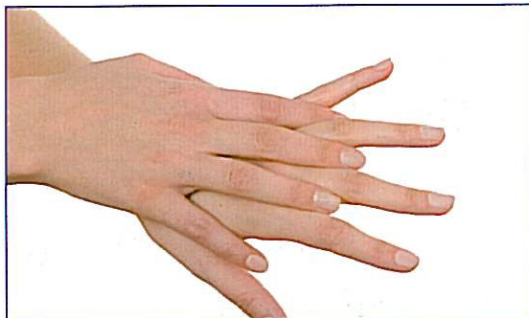
Håndryg og finger-mellemrum vaskes på begge hænder